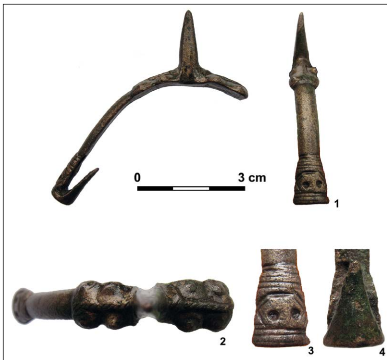
Ryc. 1. Słodkówko. Brązowa ostroga z zaczepami haczykowato zagiętymi do wnętrza: 1 – rzut i profil, 2 – widok z góry, 3 – zbliżenie na zdobienie zakończenia kabłąka, 4 – widok haczyka od wewnątrz.